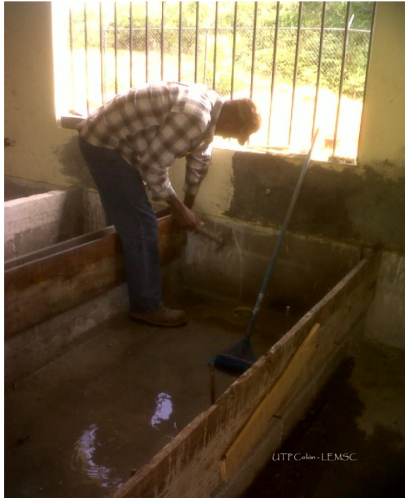
Formalateo de las Tinas de Curado