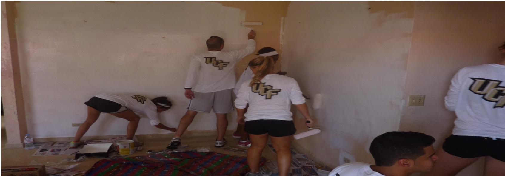
Estudiantes de la UCF pintando en los dormitorios de las Aldeas S.O.