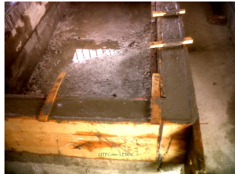
Viga de amarre sobre las Tinas de Curado