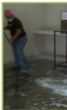
JORNADA DE LIMPIEZA