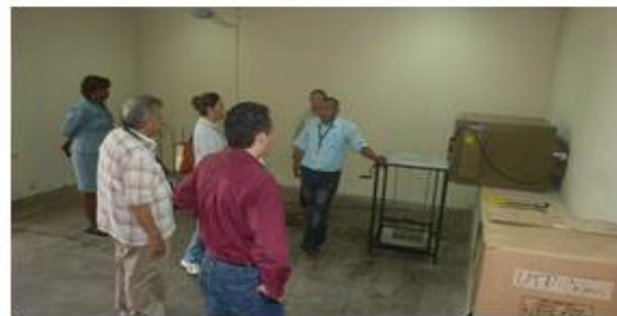
VISITA DEL CEI