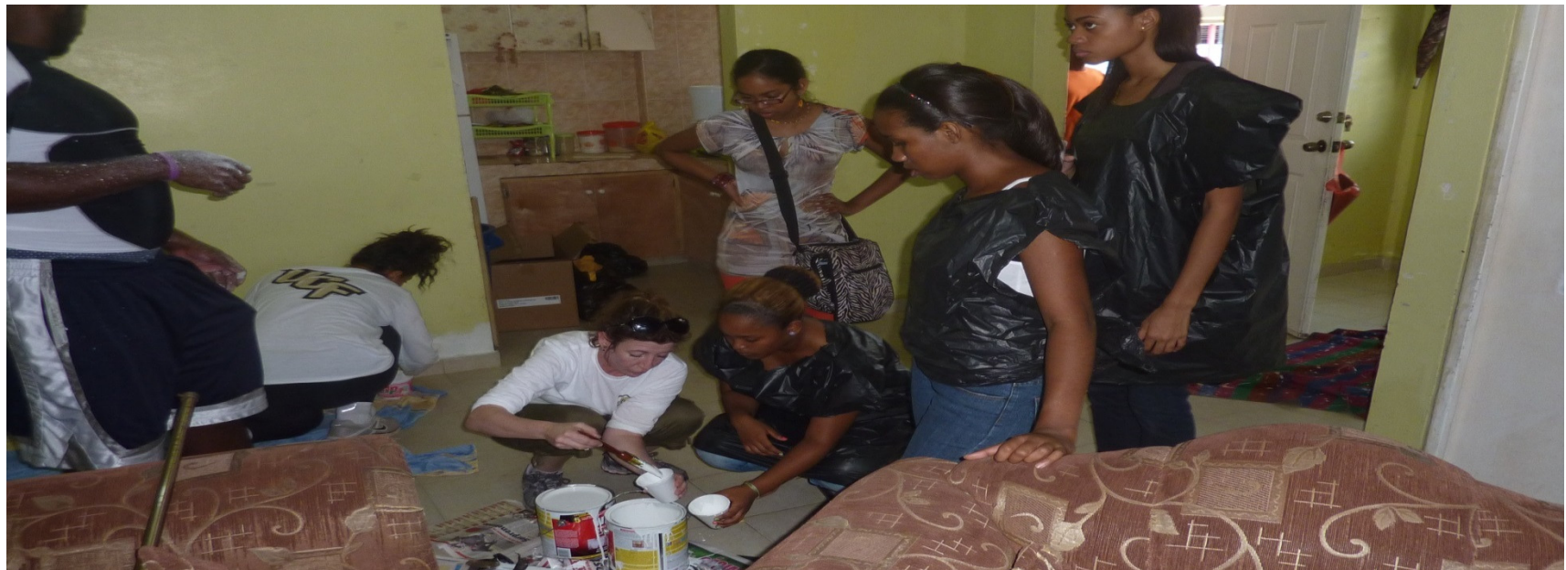
Estudiantes de UTP Colón, en labor social, juntos a los estudiantes de la Universidad Central de Florida