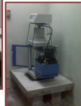
MESA PARA MAQUINA DE COMPRESIÓN