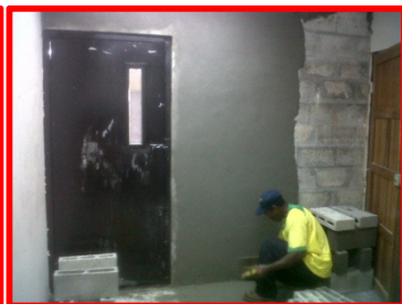
TRABAJOS DE ADECUACIÓN