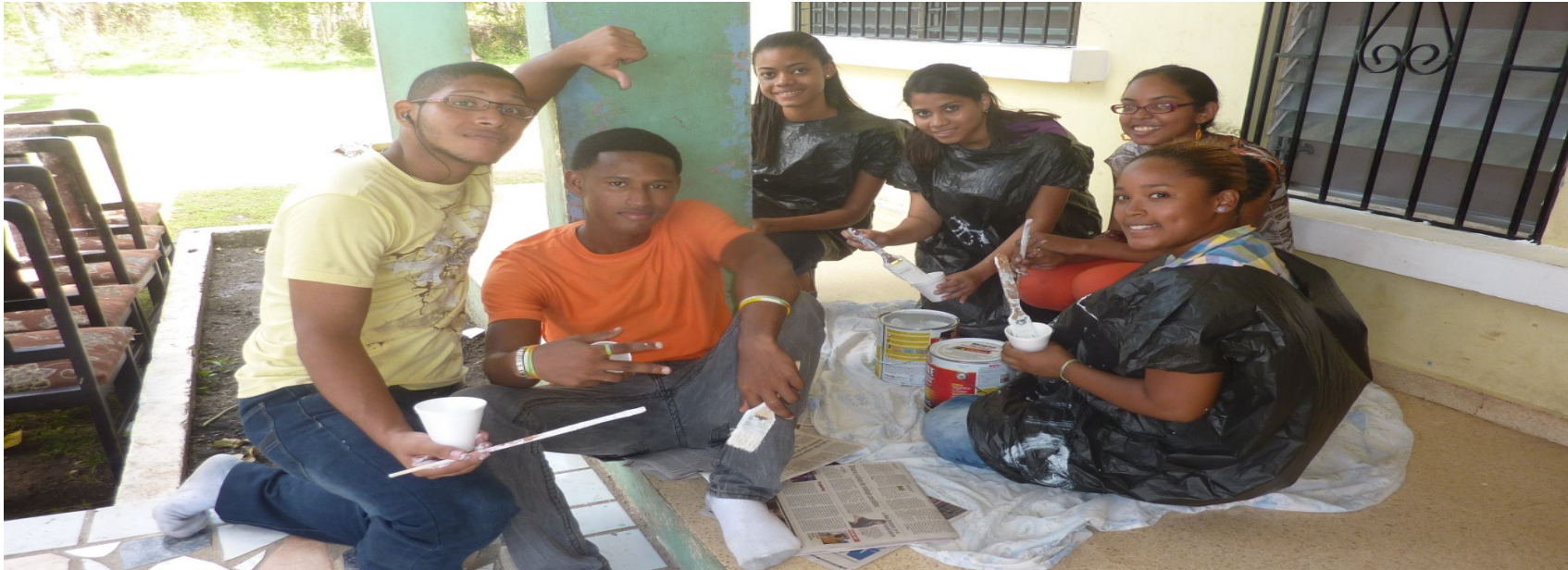
Estudiantes de UTP de Colón, preparando la mezcla de pinturas a utilizar.