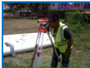
APOYO AL PROYECTO DE LA ALDESA SOS